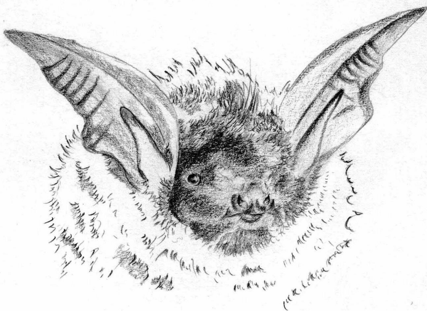
Oreillard specie – I. Naudun

Les efforts de prospection et de contrôle des gîtes doivent être poursuivis, afin d'assurer un suivi scientifique sur le long terme, et ainsi, de pouvoir évaluer l'état de santé des populations auvergnates de chiroptères.